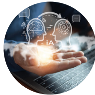
Soluciones avanzadas de atención e IA.